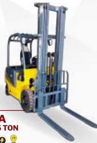
EMPIILHADEIRA HOVAM ELÉTRICA 2,5 TON