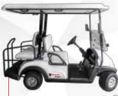
HOVAM CONFORT 4 LUGARES