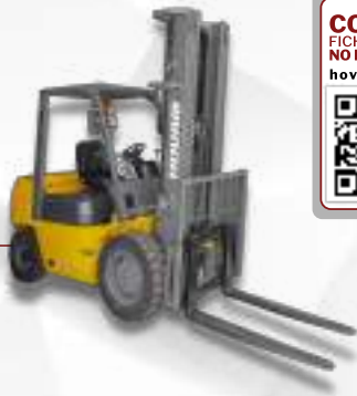
EMPIILHADEIRA HOVAM A DIESEL 4 TON