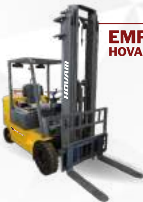
EMPIILHADEIRA HOVAM ELÉTRICA 2,5 TON BATERIA DE LÍTIU