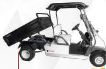
HOVAM WORK C/ CAÇAMBA