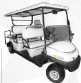
HOVAM CONFORT 6 LUGARES